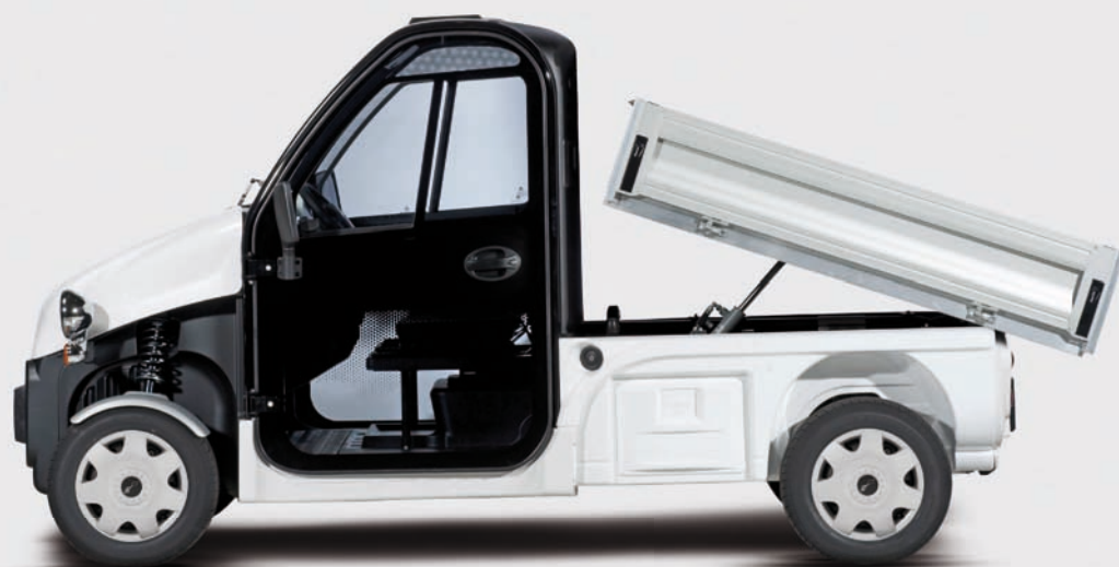
Be Sun L3 + plateau ridelle basculant hydraulique