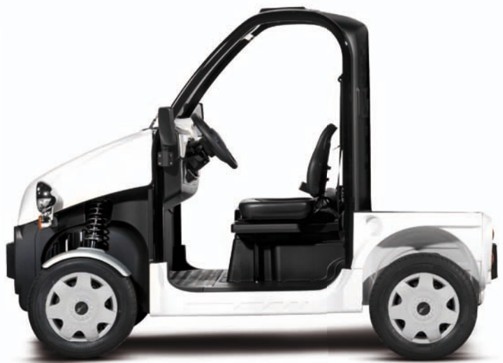
Be Sun L1 pick-up

VERSIONS ÉLECTRIQUE OU THERMIQUE CONDUITE A GAUCHE OU A DROITE