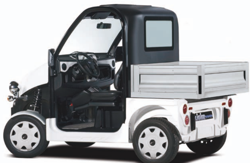
Be Sun L1 + plateau ridelles fixe