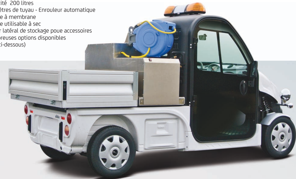
5 accessoires en option pour une utilisation optimale