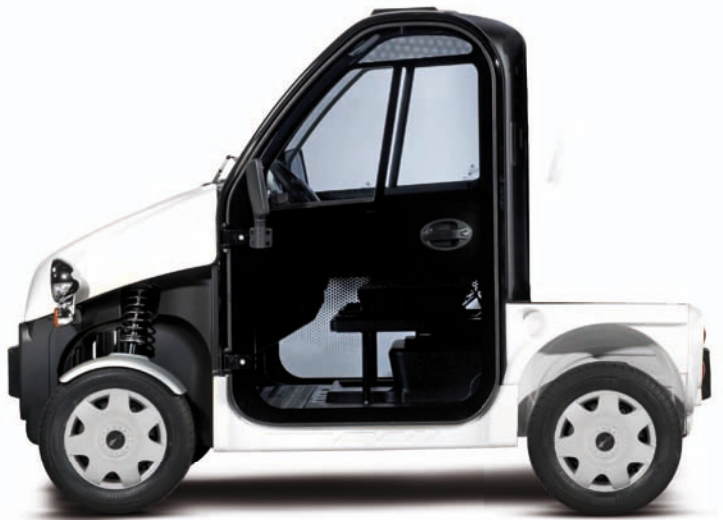
Be Sun L1 option porte gauche et droite disponible sur tous les modèles