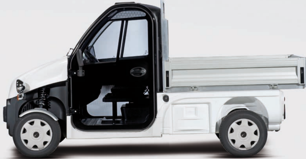
Be Sun L3 + plateau ridelle fixe + porte-outils