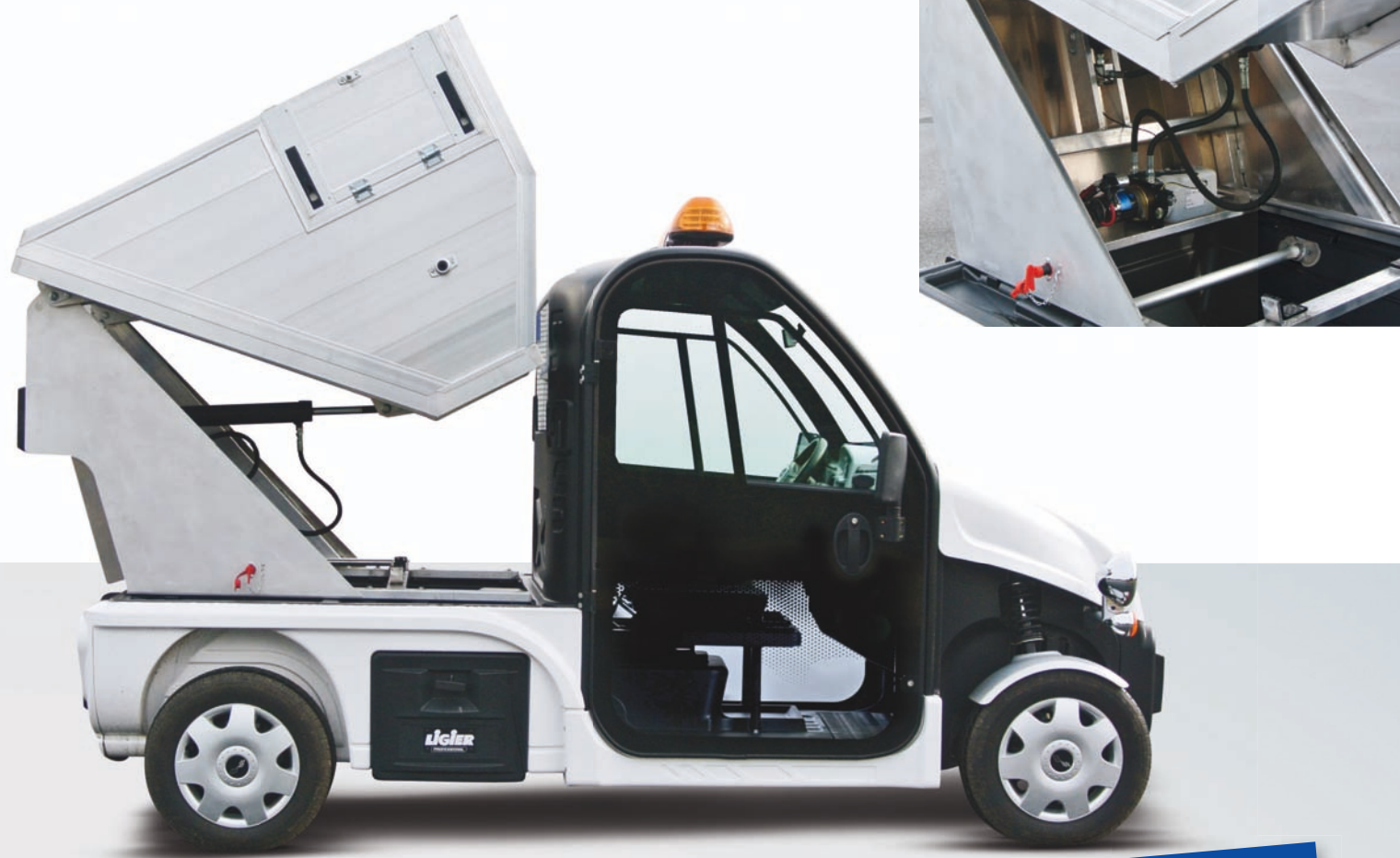
Be Sun L3 benne à déchets