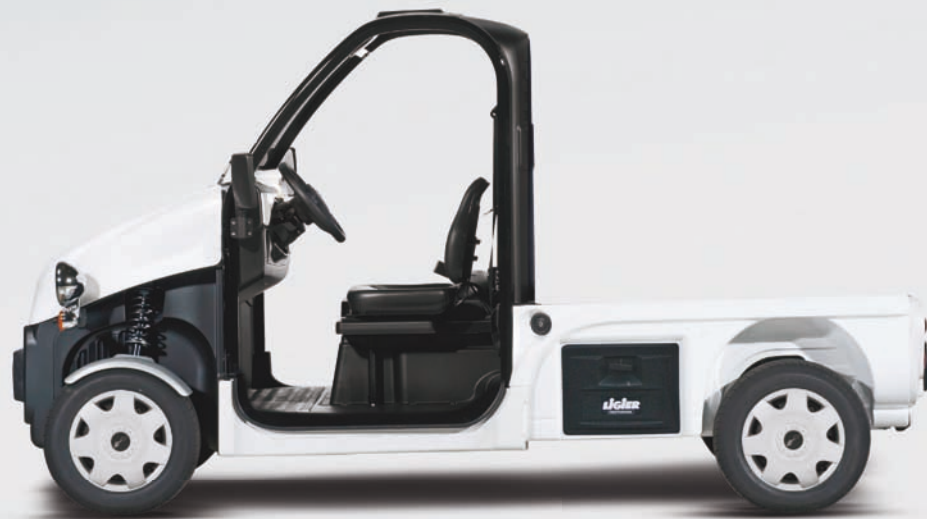
Be Sun L3 pick-up