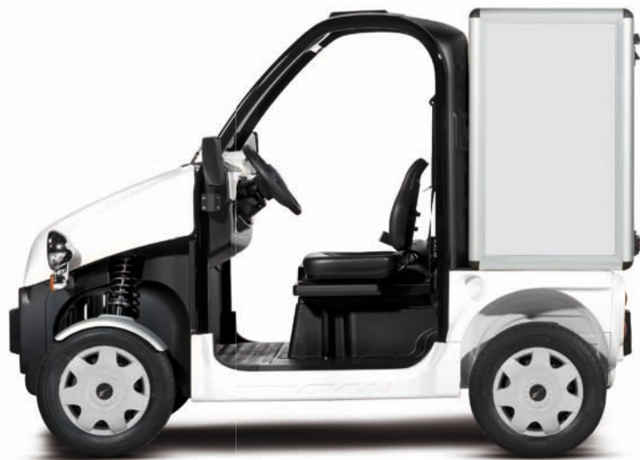
Be Sun L1 + coffre ouverture à l'arrière