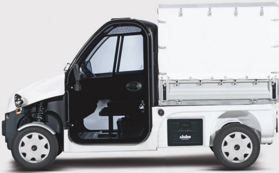
Be Sun L3 + savoyarde