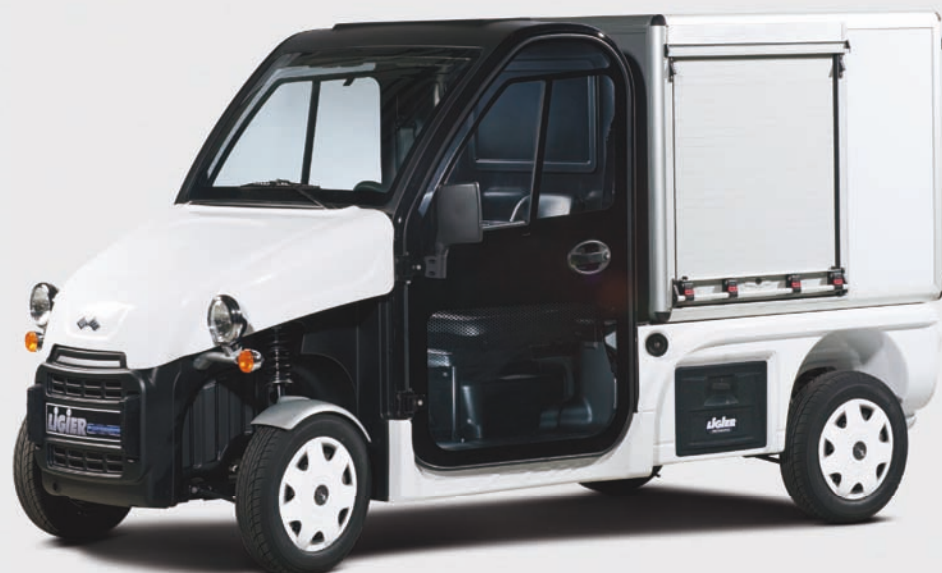
Be Sun L3 + coffre avec volet roulant