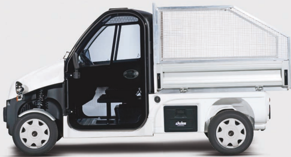
Be Sun L3 + plateau ridelles basculant hydraulique + réhausse grillagées